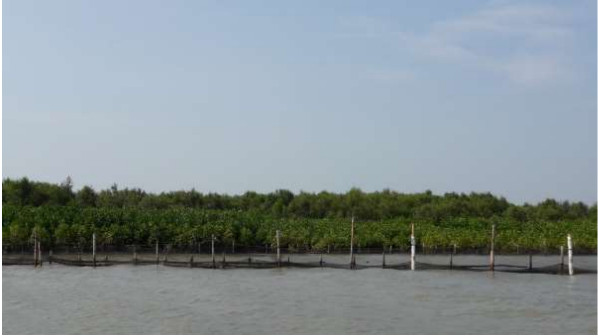
Anak pohon Rhizophora yang ditanam di balik struktur bambu pelindung di depan hutan mangrove alami di Jawa Tengah, Indonesia.